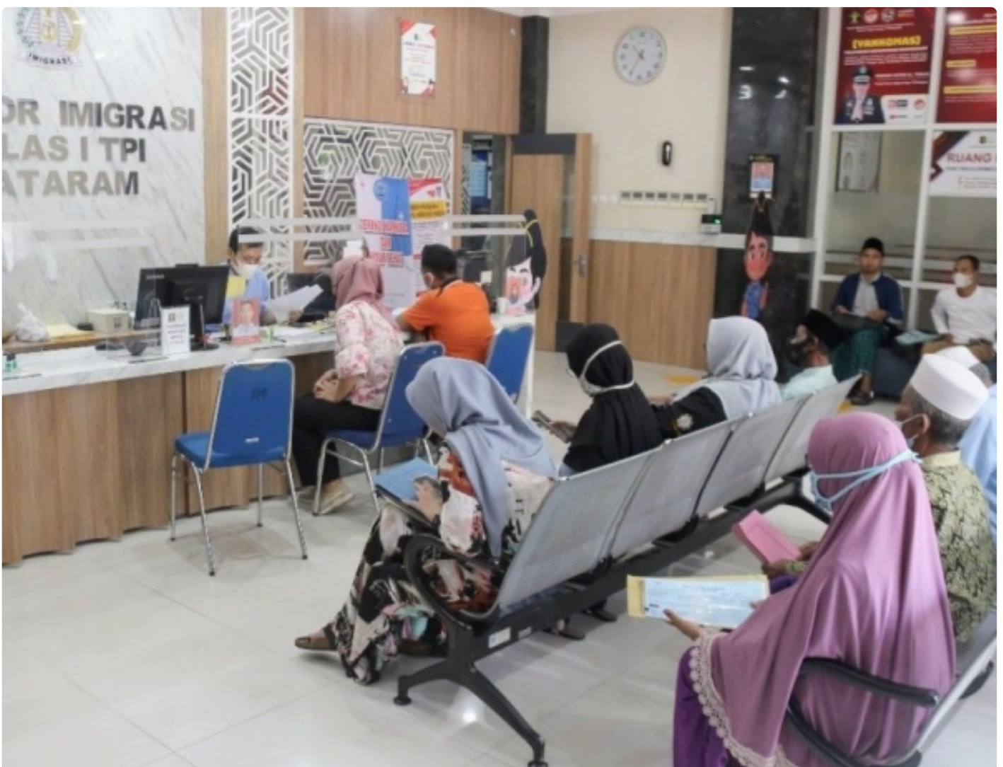
Layanan Paspor Imigrasi Mataram di Akhir Pekan, (15/01/2023)

Mataram NTB – Kantor Imigrasi Kelas I TPI Mataram Kanwil Kemenkumham NTB kembali menggelar layanan paspor simpatik yang diselenggarakan pada Sabtu dan Minggu 14 – 15 Januari 2023. Layanan ini diberikan sesuai instruksi Direktorat Jenderal Imigrasi melalui surat nomor IMI.7-UM.01.01-092, dan dilaksanakan dalam rangka memperingati Hari Bhakti Imigrasi (HBI) yang akan