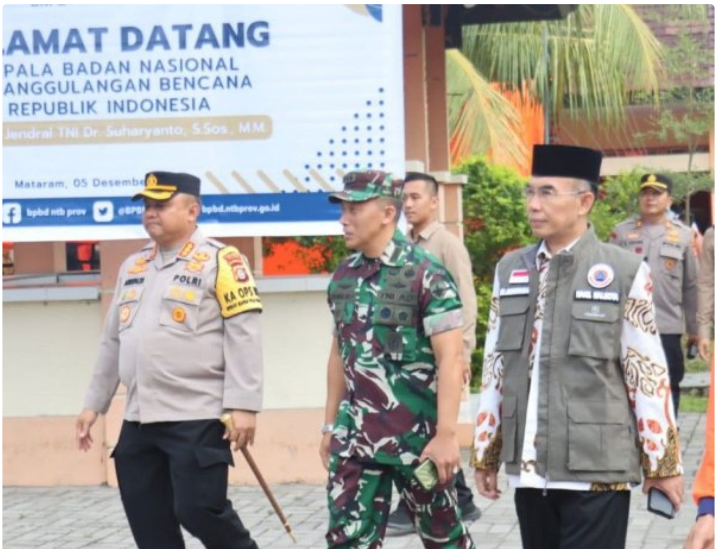
Kapolresta Mataram (Kiri) saat menghadiri acara Peletakan batu Pertama pembangunan gedung Pusdalops BPBD NTB, Kamis (05/12/2024)