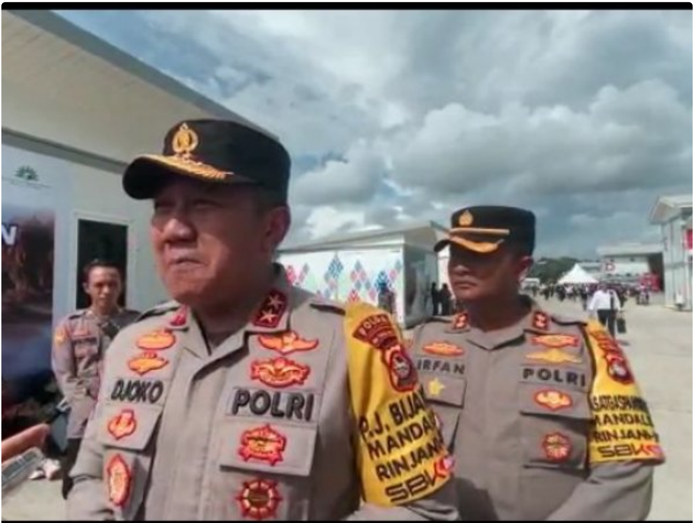
Kapolda NTB Irjen Pol Drs. Djoko Poerwanto.

Lombok Tengah - Kopolda NTB mengucapkan terimakasih kepada seluruh stakeholder yang berkecimpung dalam proses penyelenggaraan World Superbike (WSBK) Mandalika 2023, terlebih kepada seluruh anggota yang bertugas